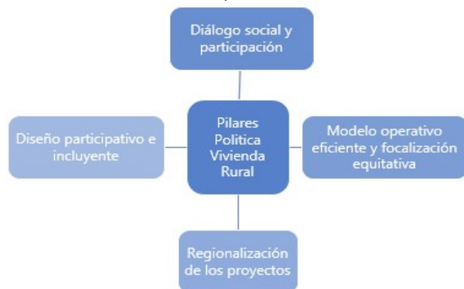
Gráfico 1. Pilares política Vivienda Rural